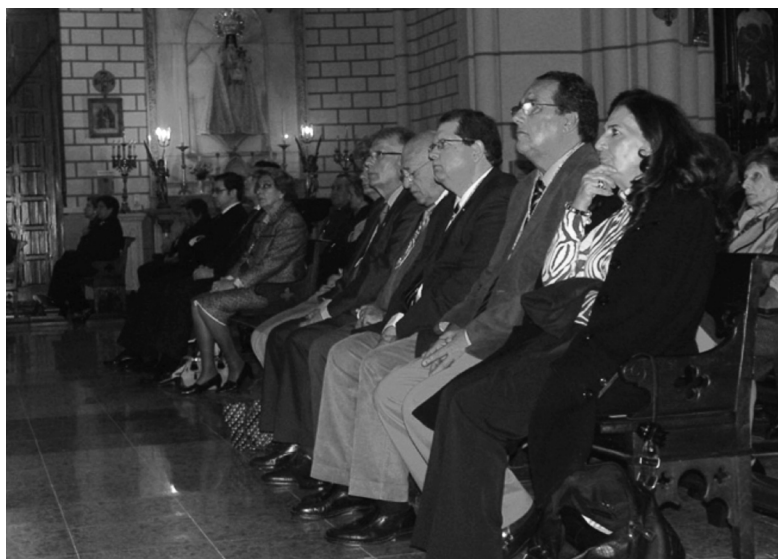
Un momento de la Función Principal