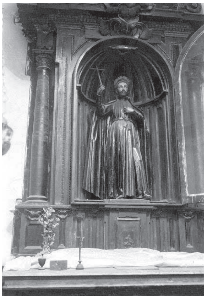
Iglesia del Santo Cristo de la Salud. (Málaga) Capilla de la Virgen de Araceli anterior a los años 20

La crónica de este día concluye así: En la noche de este día, sin haber acordado nada, fueron unos cuantos hombres pobres a la Sierra e instando mucho a los hermanos, se trajeron a María Santísima, entrando en la Parroquia a las diez de la noche.