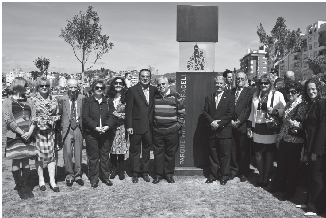
Junta de Gobierno de la Filial de Málaga

una copa de vino lucentino en la Casa Hermandad de la Cofradía de Estudiantes.