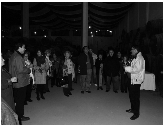
Degustación en la bodega de Aragón

Los estómagos pedían reponer fuerza y nos desplazamos a un restaurante lucentino, su nombre "Araceli", el momento era propicio para comentar la mañana, se respiraba la satisfacción de todos y el deseo de partir hacia la "Casa de la Virgen" el museo causaba expectación, son muchas las joyas que