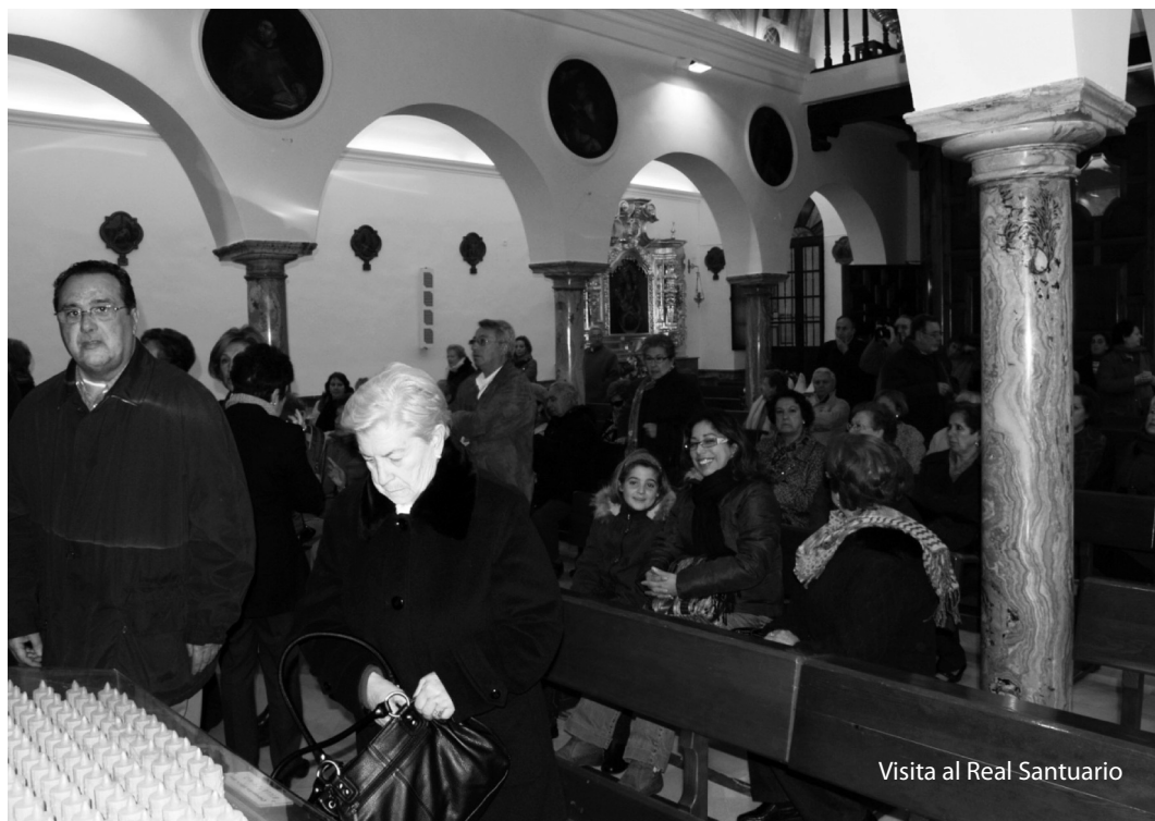
Visita al Real Santuario

momentáneo a la concurrencia, llegamos a las plantas de nuestra Madre. El Hermano Mayor de la Cofradía Matriz, nos recibió y disertó ampliamente sobre la historia y detalles del lugar que visitábamos, los peregrinos, algunos por primera vez, se quedaron asombrados ante tanta belleza de la Virgen de Araceli y su entorno, camarín, iglesia y unas vistas panorámicas que, aunque el día no era el más apropiado, permitía deleitarse