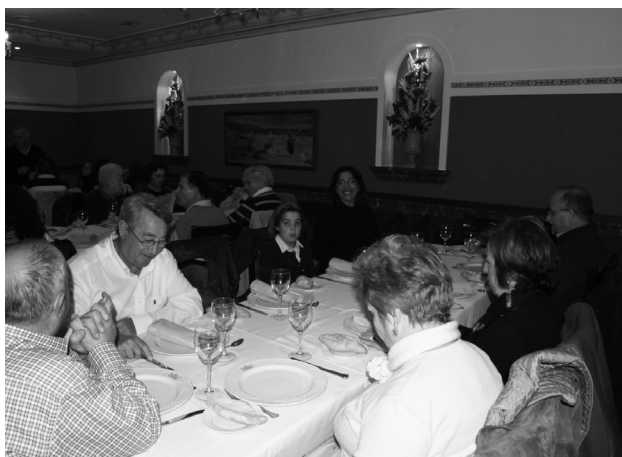
Un momento de la comida de convivencia

Un gran día de peregrinación que sin lugar a dudas repetiremos en años sucesivos.