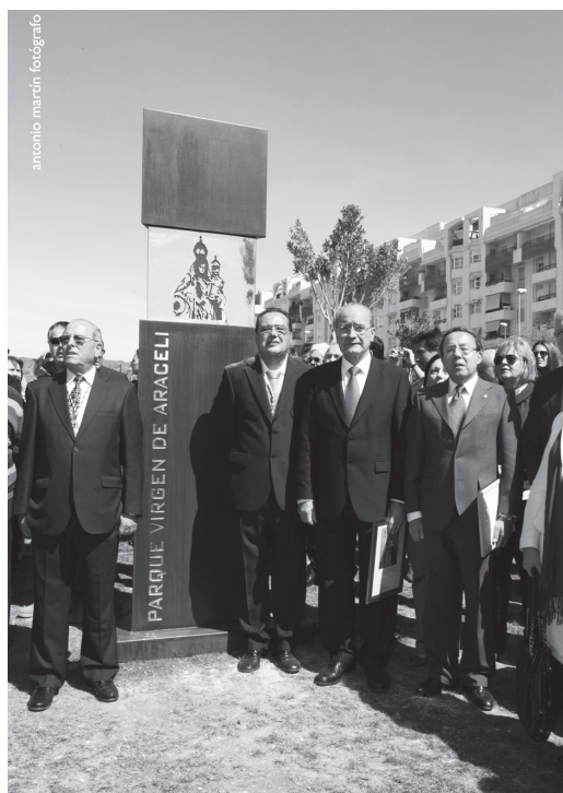
Cofradía Filial y Alcaldes de Málaga y Lucena

del Corpus Christi, la bendita Imagen de Ma Stma. de Araceli, por primera vez en su historia salió de su sede canónica, haciéndolo en Procesión al estilo de Lucena, llevada a hombros por santeros al toque de tambor.