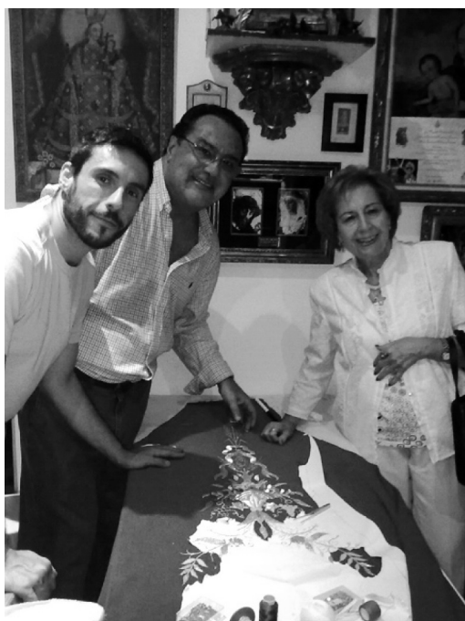
Taller de bordado