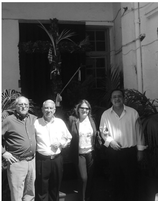
Presidente de la Agrupación de Cofradías de Gloria y miembros de la Junta de Gobierno

Este año se instaló en el corazón de Málaga, justo al lado de la Iglesia del Santo Cristo, donde se da culto a María Santísima de Araceli, el patio ricamente adornado por guirnaldas y farolillos, estaba presidido por la Cruz Gloriosa, preciosamente adornada por los cofrades, aportando cada uno de ellos un regalo alegórico a su advocación, nuestra Filial, como no, aportó un canasto de frutos del campo, haciendo honor a la Patrona del Campo Andaluz, que se situó a los pies de la Cruz.