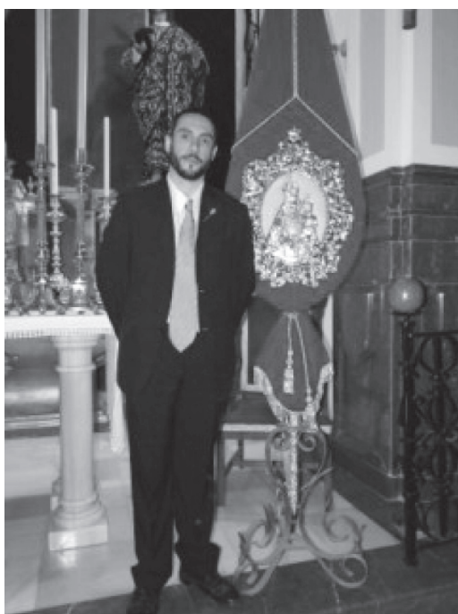
El bordador Junto al Guión

Pasito a pasito hemos conseguido un dignísimo Guión Corporativo que nos representará en determinados actos a los que éramos invitados y que hasta ahora, no podíamos corresponder por carecer de él, Corpus, desfiles Procesionales de Agrupación y Cofradías, etc..