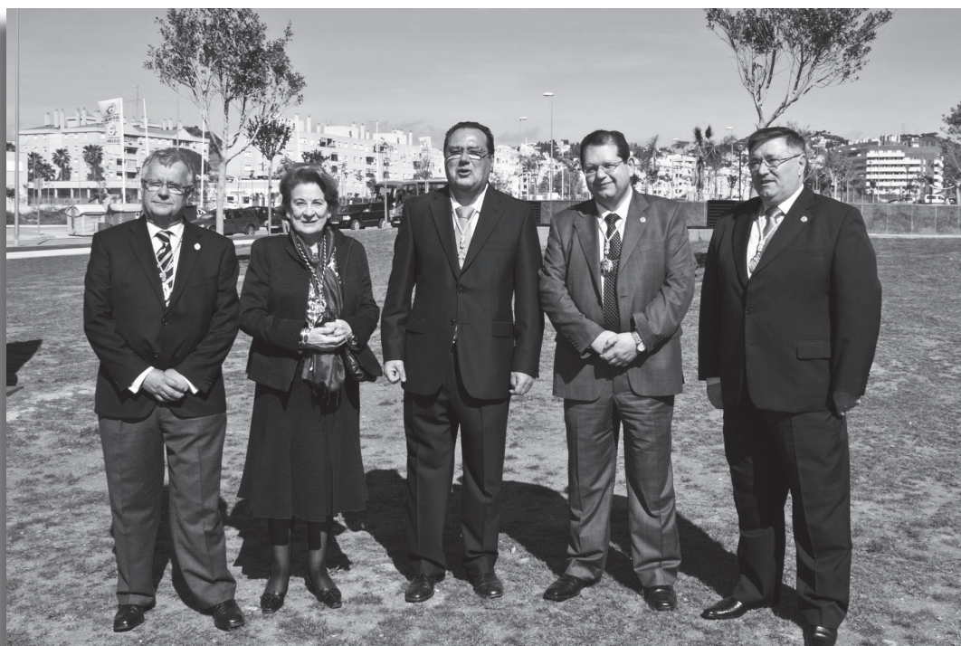
Hermano Mayor de la Cofradía Matriz y Filiales de Málaga, Madrid, Sevilla y Córdoba

El esperado momento del descubrimiento del monolito, fue recibido con una estruenda ovación y vivas a la Virgen a Málaga y a Lucena.